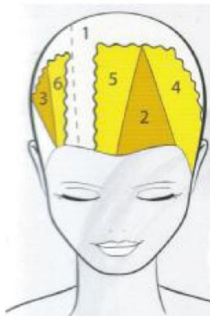
Rys. 6. Efekt koloryzacji z podziałem na 6 sekcji