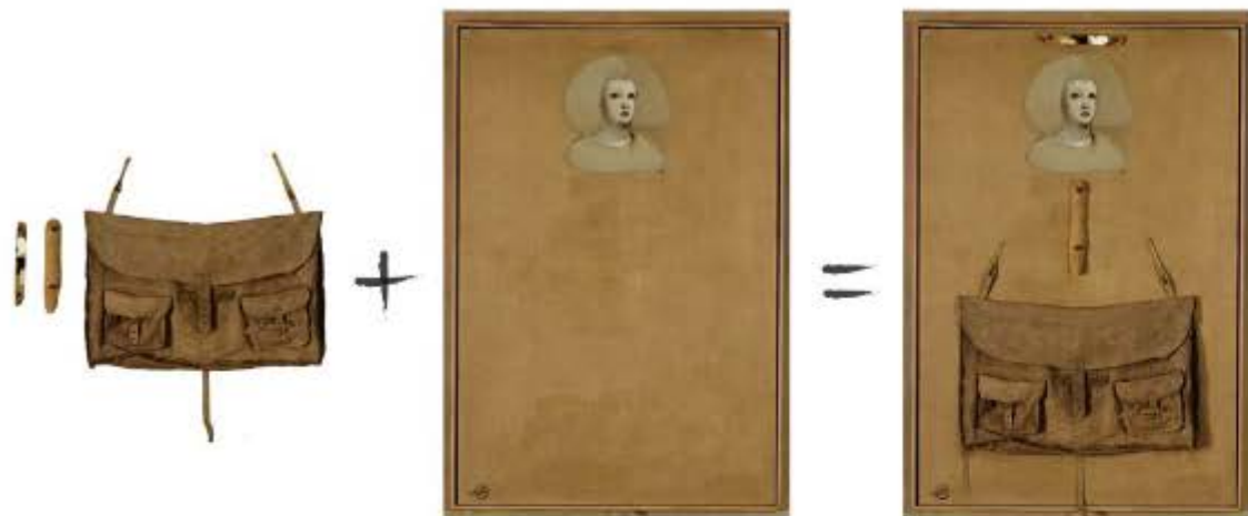
Podstawa – przedmioty (gotowe, znalezione, wykonane przez artystę)