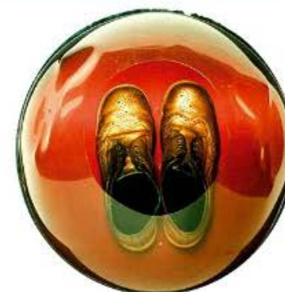
Władysław Hasior, Moje złote buty , Muzeum Tatrzańskie w Zakopanem, 1960 r.