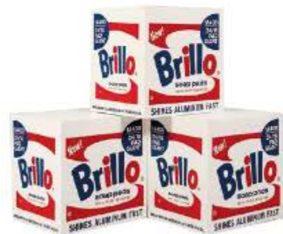
Andy Warhol [czyt.: endi torhol], Trzy pudełka Brillo [czyt.: brilo], sitodruk i farba polimerowa na drewnie, 1968 r.

Tadeusz Kantor, Infantka wg Velázquez , przedmioty z drewna i metalu, torba, farby olejne na płótnie, 1966 r.