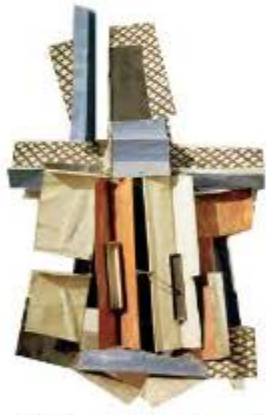
Pablo Picasso, Główna , tektura, blacha, drewno, drut, 1914 r. – kubizm

Dzieła będące przykładami sztuki współczesnej, a więc powstałe w drugiej połowie XX w., często mają nietypowe formy. Mogą np. przypominać rzeźby, obrazy lub budowle, łączyć w sobie ich cechy, a nawet mieć postać nagrania audio-wideo czy pliku komputerowego. Nie możemy wówczas zaliczyć ich do jednej dziedziny sztuki. Taki niezwykle wygląd dzieł wywodzi się z działań kubistów, dadaistów i surrealistów z początku XX w. Artyści tych nurtów jako pierwsi wykorzystywali w swoich pracach tworzywa z odpadów, przedmioty codziennego użytku, a czasem nawet zastępowali nimi tradycyjne dzieła sztuki. Powstawały w ten sposób przedmioty gotowe (ready made) – fabrycznie produkowane przedmioty, wybierane przez artystę i nazywane dziełami – oraz przedmioty znalezione , czyli zwykle obiekty przetwarzane lub włączane do kompozycji. Nieznane dotychczasowej sztuce obiekty po wystawieniu w galerii lub muzeum traciły funkcję użytkową i zyskiwały nowe znaczenia, np. dzięki zagadkowemu tytułowi oraz dzięki temu, że widz patrzy na nie w innej sytuacji niż zazwyczaj.