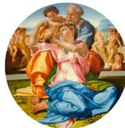
Michał Anioł, Święta Rodzina , Galeria Uffizi we Florencji, 1505–1506 r.