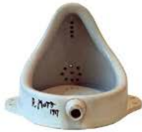
Marcel Duchamp, Fontanna , porcelanowy pisuar, 1917 r. – dadaizm