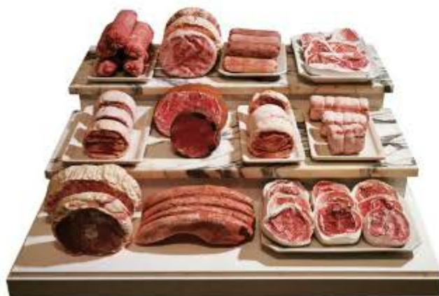
Claes Oldenburg, Mięso , gips, metal, emalia, przewód elektryczny, naczynia i blaty, 1964 r.

Współczesnymi artystami, którzy wykorzystywali codzienne przedmioty w swoich dziełach, wykonywali obiekty do złudzenia je przypominające czy też zastępowali nimi prace artystyczne, byli twórcy z nurtu pop-art . Popartyści obserwowali nadmiar produktów dostępnych w sklepach i takie zjawiska, jak kino, reklama, komiks i telewizja. Pragnęli, aby ich dzieła były równie atrakcyjne i dostępne dla szerokiego grona odbiorców, jak wytwory kultury masowej. Jednocześnie byli krytycznymi komentatorami rzeczywistości. Ich prace często zwracają uwagę na banalność, kiczowatość i brzydotę otaczających nas przedmiotów.