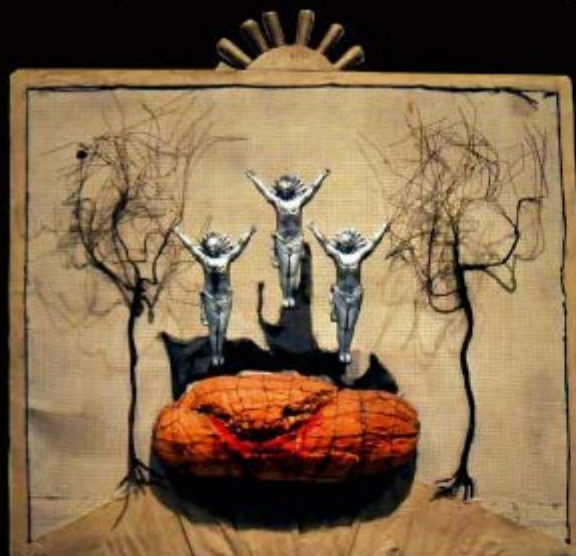
Władysław Hasior, Golgota

Artysta połączył tkaniny, druty, metalowe figurki z krzyży i bochenek chleba w dzieło mówiące o sensie męki Chrystusa. Asamblaż jest z jednej strony pejzażem ukazującym górę Golgotę z ukrzyżowanymi, a z drugiej – przywołuje symbolikę ciała Jezusa jako chleba dającego nam życie.