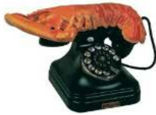
Salvador Dalí, Homage-telefon , gipsowy odlew homara, telefon, 1938 r. – surrealizm