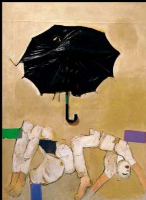
Tadeusz Kantor, Ambalaż - przedmioty, postacie

Artysta połączył tkaniny, druty, metalowe figurki z krzyży i bochenek chleba w dzieło mówiące o sensie męki Chrystusa. Asamblaż jest z jednej strony pejzażem ukazującym górę Golgotę z ukrzyżowanymi, a z drugiej – przywołuje symbolikę ciała Jezusa jako chleba dającego nam życie.