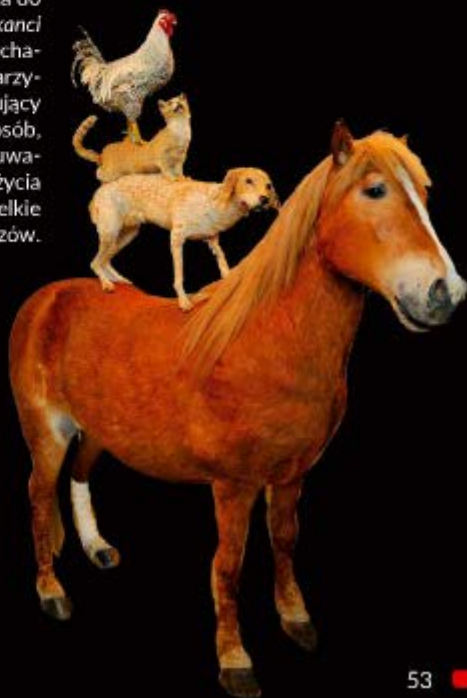
Katarzyna Kozyra, Piramida zwierząt

Instalacja nawiązująca do baśni braci Grimm Muzykanci z Bremy składa się z wypchniętych ciał zwierząt. Towarzyszy jej film dokumentujący powstawanie pracy. Sposób, w jaki artystka zwróciła uwagę na zagadnienie cyklu życia i śmierci, wzbudził wielkie kontrowersje wśród widzów.