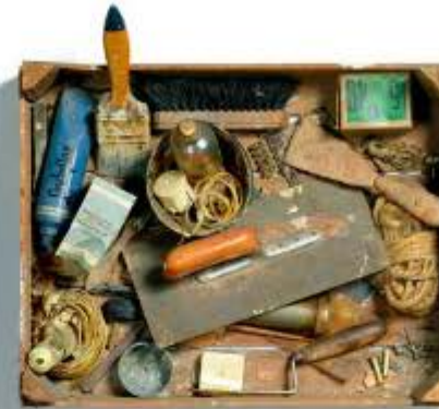
Daniel Spoerri, Kto wie, gdzie są schody na górę i w dół , 1964 r.