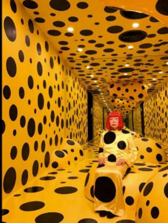
Yayoi [czyt.: jajoji] Kusama, Obsesja kropek - dzień

W powierzchni obrazu został umieszczony zniszczony parasol. Wielokrotne stosowanie tego przedmiotu jest jednym ze znaków rozpoznawczych twórczości polskiego artysty, który używał w swoich dziełach także papierowych toreb po farbach i cemente, płóciennych worków i plecaków.